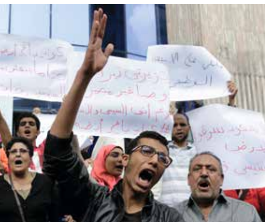
Aktivisten protestieren gegen die Übergabe von zwei strategisch wichtigen Inseln im Roten Meer an Saudi-Arabien.