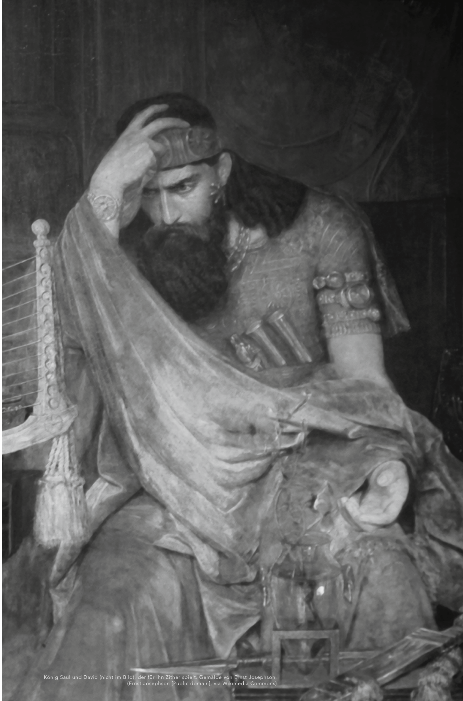
König Saul und David (nicht im Bild), der für ihn Zither spielt. Gemälde von Ernst Josephson. (Ernst Josephson [Public domain], via Wikimedia Commons)

Wie Gottes Plan für das Amt von Priester und König Israel schützen sollte.